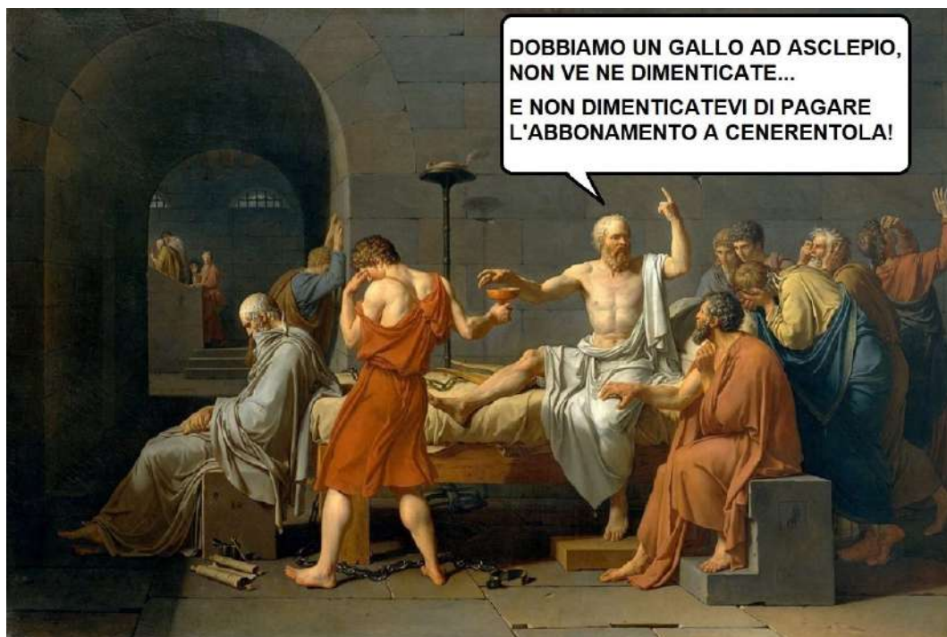
Jacques-Louis David (1748-1825): La morte di Socrate, modificato

Il catalogo della Galzerano è consultabile anche sul sito www.cenerentola.info