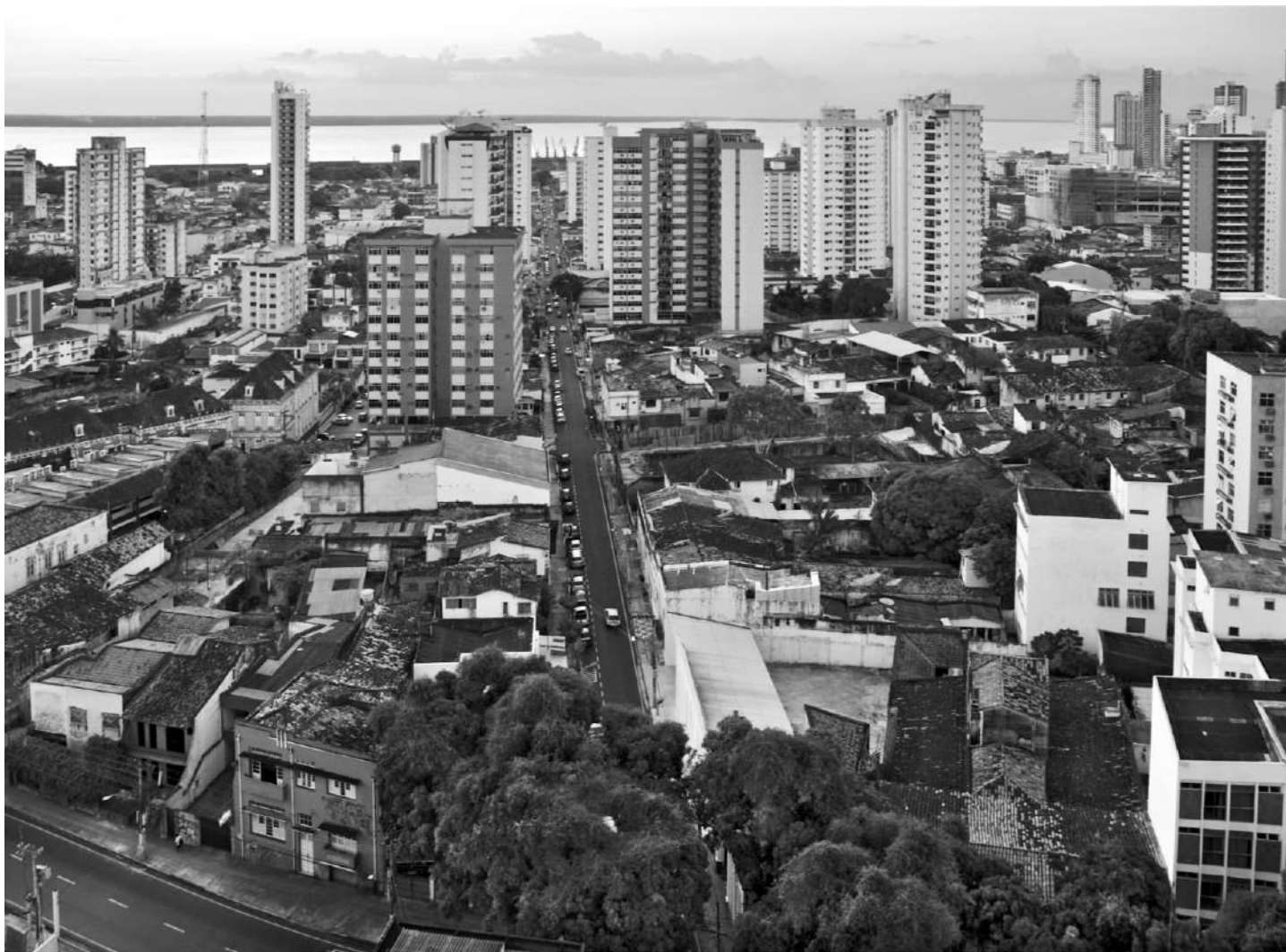
Il centro di Belém