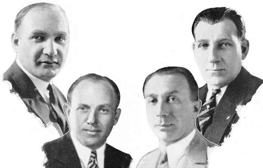
I fratelli Warner, fondatori della Warner Bros

Probabilmente quando leggerete questo articolo avrete maggiori informazioni e si sarà fatta chiarezza su un'operazione da poco annunciata che sta facendo parlare e anche preoccupare: l'acquisizione della Warner Bros, la celebre casa di produzione e distribuzione cinematografica, da parte di Netflix, colosso dello streaming.