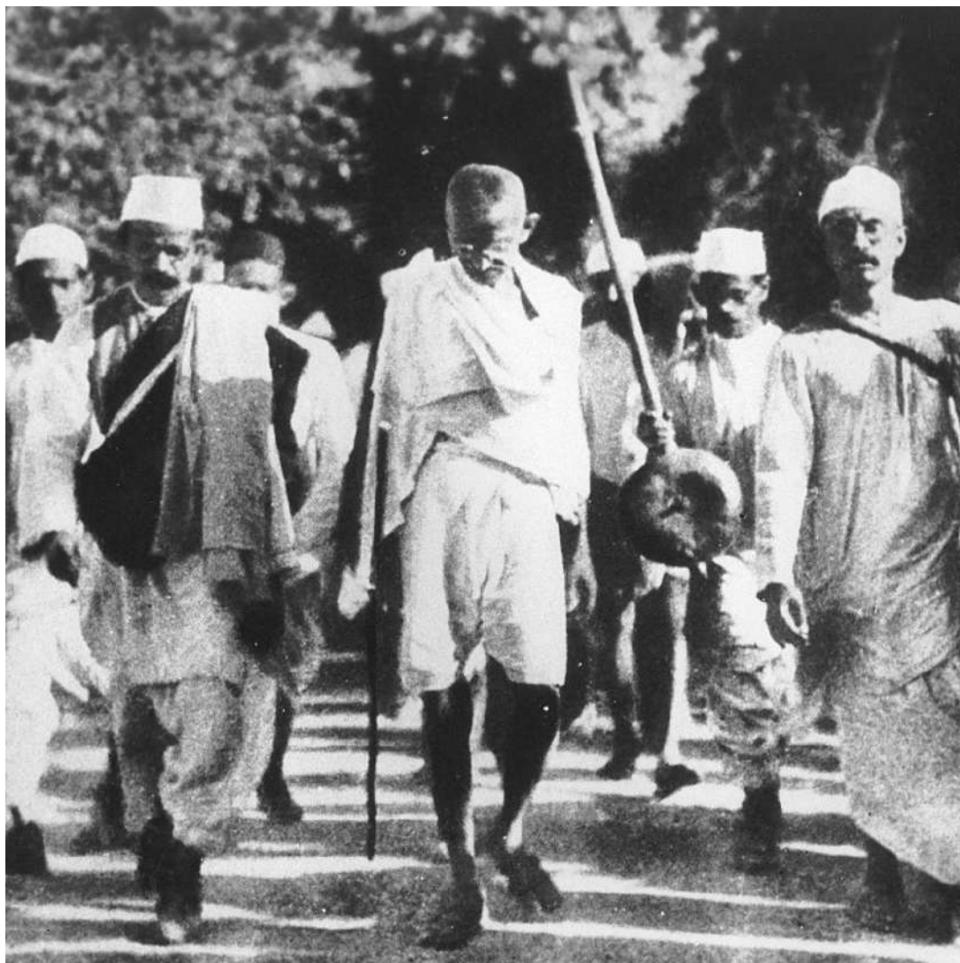
Gandhi durante la "marcia del sale" (1930)

Così commentavano negli anni sessanta del Novecento, con un misto di nostalgia e di autocompiamento, coloro che erano