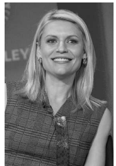
Claire Danes