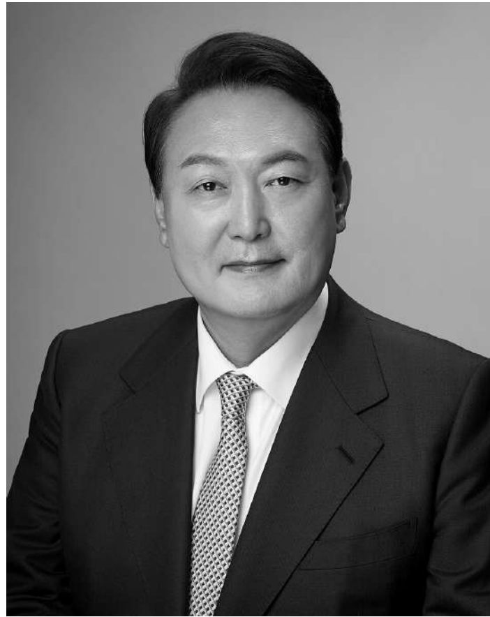
Yoon Suk Yeol, ex presidente della Corea del Sud

Il governo di Israele si è impegnato a collaborare con il Somaliland con rife-