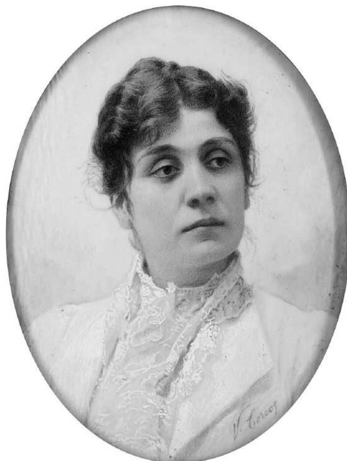
Eleonora Duse in un ritratto di Vittorio Matteo Corcos